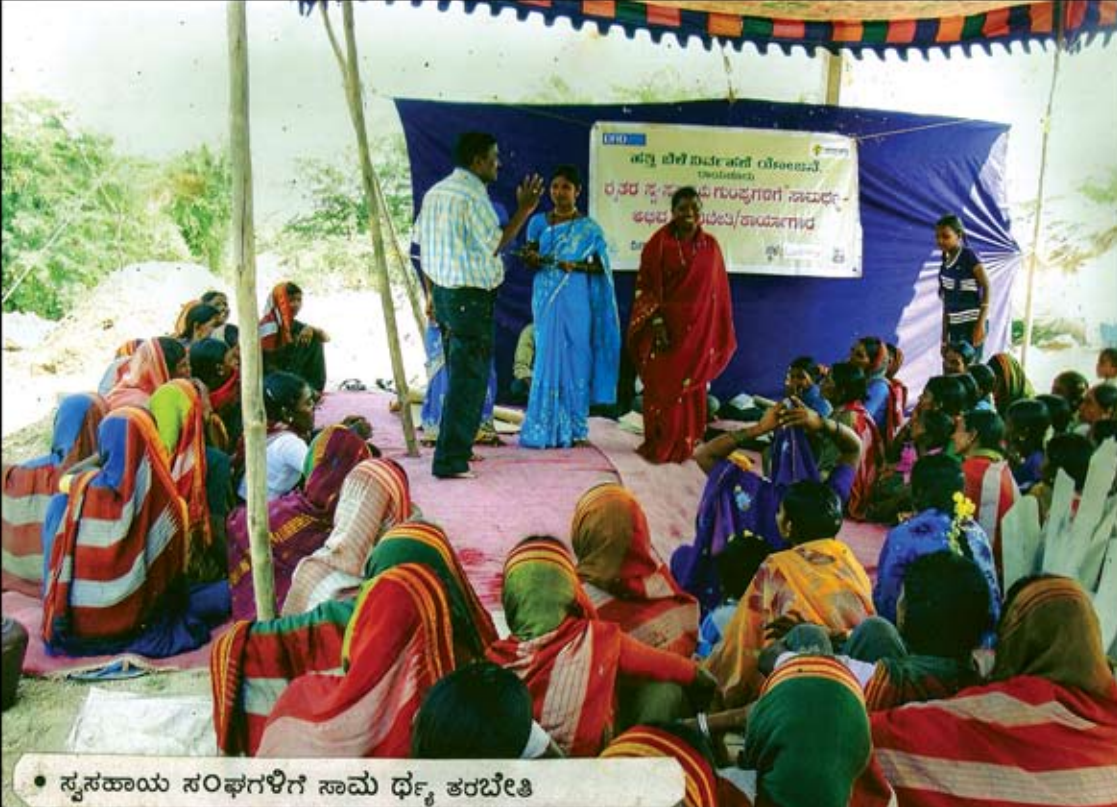
• ಸ್ಮಶಾನ್ಯ ಸಂಘಗಳಿಗೆ ಸಾಮರ್ಥ್ಯ ತರಬೇತಿ

ತಮ್ಮ ಹಳ್ಳಗಳಲ್ಲಿ ತಮ್ಮ ನ್ಯಾಯಸಮ್ಮತವಾದ ಸ್ಥಾನಮಾನಗಳನ್ನು ಮರಳಿ ಪಡೆಯುವುದು ಎಂದರೆ ಸಾರಾಂಶದಲ್ಲಿ ಮಹಿಳೆಯರು ಒಂದು ಸಮಷ್ಟಿಯಾಗಿ ಪ್ರತಿಷ್ಠಾಪಿತ ದಮನ ಮತ್ತು ಶೋಷಣೆಗಳನ್ನು ಪ್ರತಿರೋಧಿಸುವುದೇ ಆಗಿತ್ತಾದ್ದರಿಂದ ಮಹಿಳೆಯರ ಪಾಲಿಗೆ ವಾಸ್ತವದಲ್ಲಿ ಅದೊಂದು ಸುದೀರ್ಘ ಹೋರಾಟವೇ ಆಗಿತ್ತು. ಒಗ್ಗಟ್ಟಾಗಿ ಸೇರುವ. ಒಗ್ಗಟ್ಟಿನಿಂದ ಮುನ್ನಾಗುವ ಹಾಗೂ ಒಗ್ಗಟ್ಟಿನಿಂದಲೇ ಕೆಲಸ ಮಾಡುವ ತಮ್ಮ ಶಕ್ತಿಸಾಮರ್ಥ್ಯಗಳನ್ನು ನಿರೂಪಿಸುವುದಕ್ಕಾಗಿ ಈ ಮಹಿಳೆಯರನ್ನು ನಿರಂತರ ಪರೀಕ್ಷೆಗಳಿಗೆ ದೂಡಲಾಯಿತು. ಅದರರ್ಥ, ಈ ಮಹಿಳೆಯರು ತಮ್ಮ ತಮ್ಮ ಕುಟುಂಬಗಳ ಒಳಗೇ ಸವಾಲುಗಳನ್ನು ಎದುರಿಸಬೇಕಾಯಿತು; ತಮ್ಮ ದಲಿತ ಸಮುದಾಯದ ಹಂತದಲ್ಲೂ ಅವರು ಸಮಷ್ಟಿ ಪುರುಷಪ್ರಧಾನ ಪ್ರತಿರೋಧಕ್ಕೆ ಮುಖಾಮುಖಿಯಾಗಬೇಕಾಯಿತು; ಅಷ್ಟೇ ಅಲ್ಲದೇ, ಹಳ್ಳಗಳಲ್ಲಿ ಆಳವಾಗಿ ಬೇರೂರಿದ್ದ ಉಗ್ರ ಪುರುಷಪ್ರಧಾನತೆಯ ತಡೆಗೋಡೆಗಳಿಗೆ ಸವಾಲೊಡ್ಡಬೇಕಾಯಿತು. ಕೆಲವು ಸಂದರ್ಭಗಳಲ್ಲಂತೂ ಈ ಮಹಿಳೆಯರು ಪುರುಷಾಧಿಪತ್ಯದ ಎಲ್ಲಾ ಅಡೆತಡೆಗಳನ್ನು ಧೈರ್ಯದಿಂದ ಬದಿಗಿ ಸರಿಸಿ ಸರ್ಕಾರದ ಸಾರ್ವಜನಿಕ ಕೆಲಸಗಳ ಗುತ್ತಿಗೆಗಳನ್ನು ಪಡೆಯುವ ತನಕವೂ ಹೋದರು. ಮುದ್ದನಗುಡ್ಡಿ ಹಳ್ಳಿಯಲ್ಲಿ ದಲಿತ ಮಹಿಳೆಯರೇ ಗುತ್ತಿಗೆ ಪಡೆದು ನಿರ್ಮಿಸಿದ ರಸ್ತೆ ಇದಕ್ಕೊಂದು ಅದ್ಭುತ ನಿದರ್ಶನ. ದಲಿತ ಮಹಿಳೆಯರ ಇಂತಹ ಒಂದೊಂದು ಸಾಹಸವೂ ಅಸಲಿಗೆ ವಿಭಿನ್ನ ಶಕ್ತಿಕೇಂದ್ರಗಳ ವಿರುದ್ಧದ ದಿಟ್ಟ ಹೋರಾಟಗಾಥೆಯಾಗಿತ್ತು. ಸಂಘಗಳ ನೆರಳಿನಲ್ಲಿ ಪರಸ್ಪರ ಒಡನಾಡುವ ಮೂಲಕ ಈ ಮಹಿಳೆಯರು ಬೆಳೆಸಿಕೊಂಡ ಸೌಹಾರ್ದ ಐಕ್ಯತೆಯೇ ಅವರಲ್ಲಿ ಅಂತಹ ಅದ್ಭುತ ಆತ್ಮಸ್ಥೈರ್ಯವನ್ನು ತುಂಬಿತ್ತು.